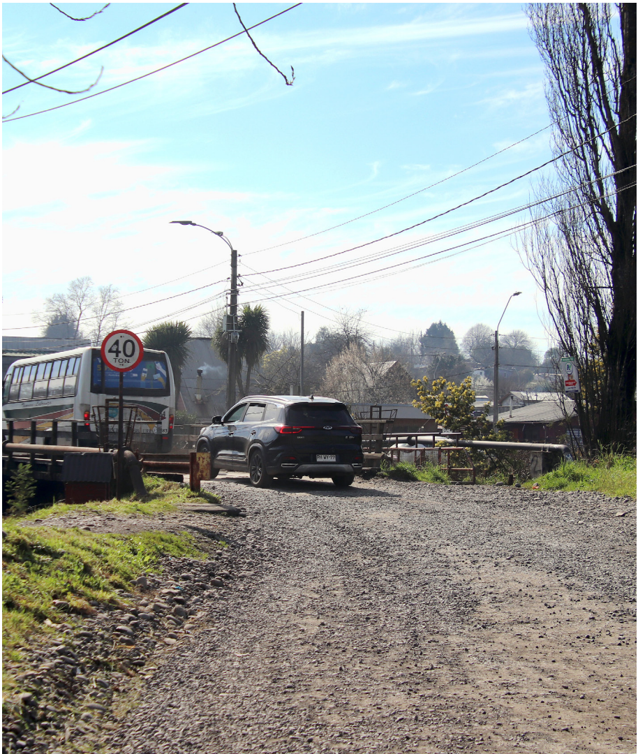
Los alrededores del puente Pfeiffer son deshabitados, poco iluminados e ideales para que se cometan delitos.

Finalmente, el oficial reiteró que la denuncia formal es el primer paso para combatir estos delitos y detener a quienes están operando en esta pampa.