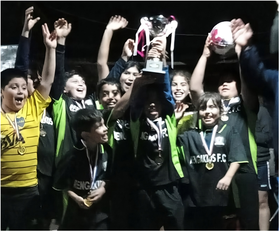
El día que ganaron la copa en Nueva Imperial fue uno de los más felices en la vida de estos niños de la zona rural.

La única ayuda formal que han obtenido provino de la Municipalidad de Nueva Imperial, que donó algunos implementos. “Hasta ahora, nadie ha llegado a preguntar qué necesitamos”, afirma el entrenador,