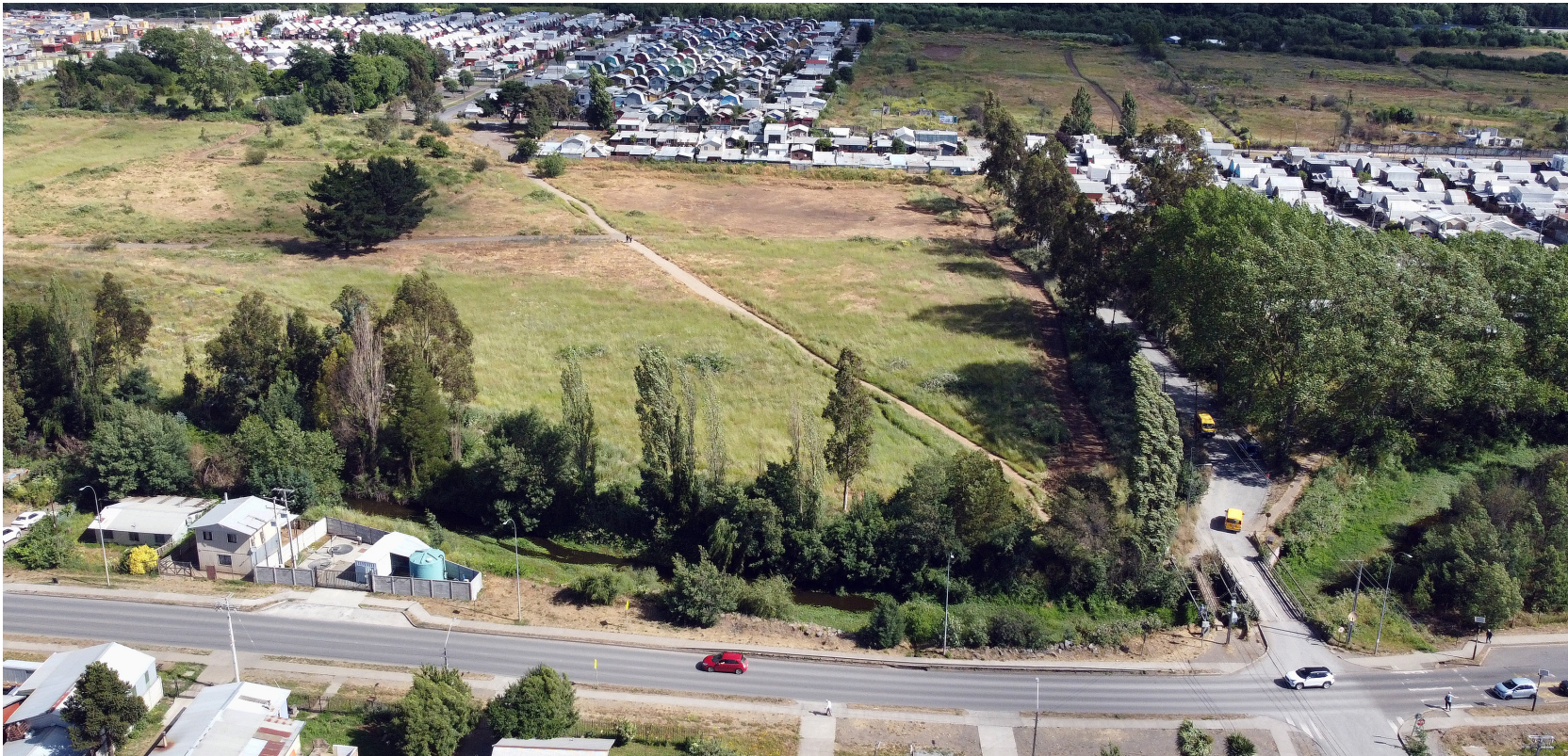
Los senderos de esta pampa suelen ser utilizados por los vecinos que se bajan de la locomoción colectiva para acortar camino rumbo a sus respectivos domicilios.

ANTISOCIALES INTERCEPTAN A QUIENES ACORTAN CAMINO POR LOS SENDEROS