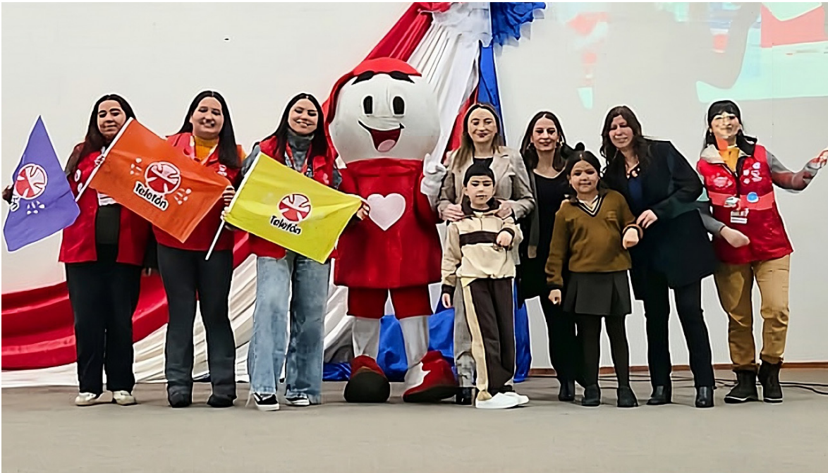
Para la comunidad escolar, participar en estas instancias va directamente ligado al proyecto educativo del establecimiento que se ubica en calle 1 Norte.