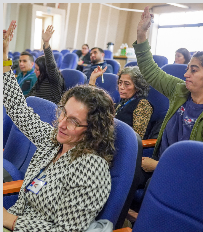
En el Servicio de Salud Araucanía Norte buscan una cultura institucional basada en la equidad y el respeto.

A través de este tipo de instancias formativas, el Ssan reafirma su compromiso con la promoción de una cultura institucional basada en la equidad y el respeto, buscando el máximo desarrollo de todas las personas sin distinción.