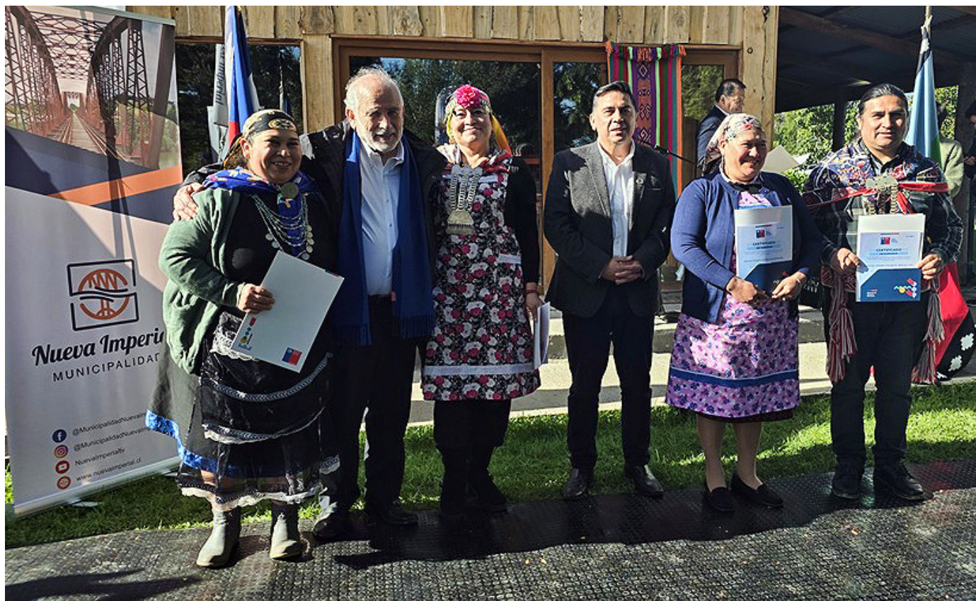
El Ministerio de Vivienda reconoció el Kimün a los comités en Nueva Imperial y Padre Las Casas, donde se entregaron los subsidios de vivienda para los machis.

rol: el de residencia para la machi y su familia, e incorporan un recinto complementario con una sala de atención para practicar la medicina ancestral mapuche.